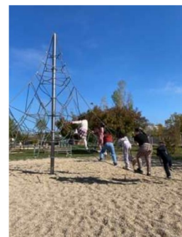
Les CP de l'école de Castillon la Bataille