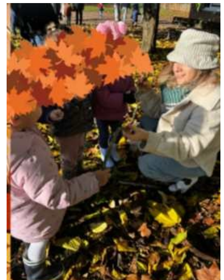
Classe de PS de l'école de Castillon la Bataille