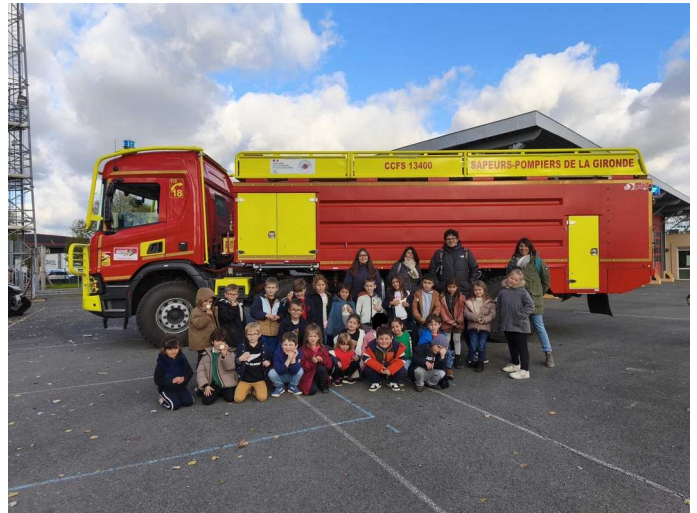
La classe de GS de l'école Belvès de Castillon

Nous avons trouvé cette visite incroyable et très impressionnante. Plusieurs enfants ont envie de devenir pompiers mais d'autres enfants ont trouvé que ce métier était trop dangereux.